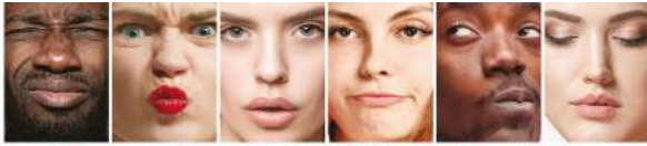
Your perfect smile. Before and after

La misma solución no es apta para todos.